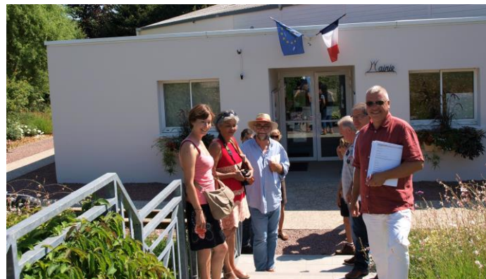
Visite du 5 août 2015