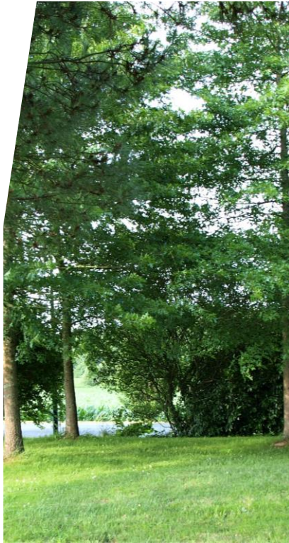
Parc du côté mairie